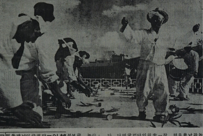
美의 對파키스탄 F16 機 제공 對應

【서울 24일 특파원 특보】 한국 내각은 내달에 대폭 개관될 예정이다. 이는 자민당 간사장이 새 카포르 대통령에 전대통령으로 당선되어, 당내 권력이 집중될 것으로 보인다.