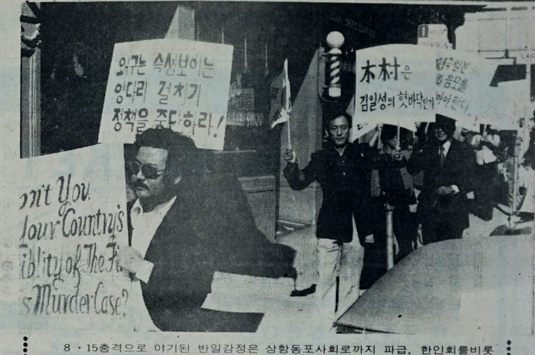
8·15승격으로 아기된 반일감정은 상항동포사회까지 파급, 한인회비롯한 이 지역 교포들도 광기대회를 열고 일본의 망성을 촉구했다.