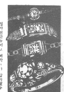
DETOR'S Cor. Fort & Mele Sts. Phone 3521

외교정책은 권력마신을 위하여 외교정책은 권력마신을 위하여 외교정책은 권력마신을 위하여